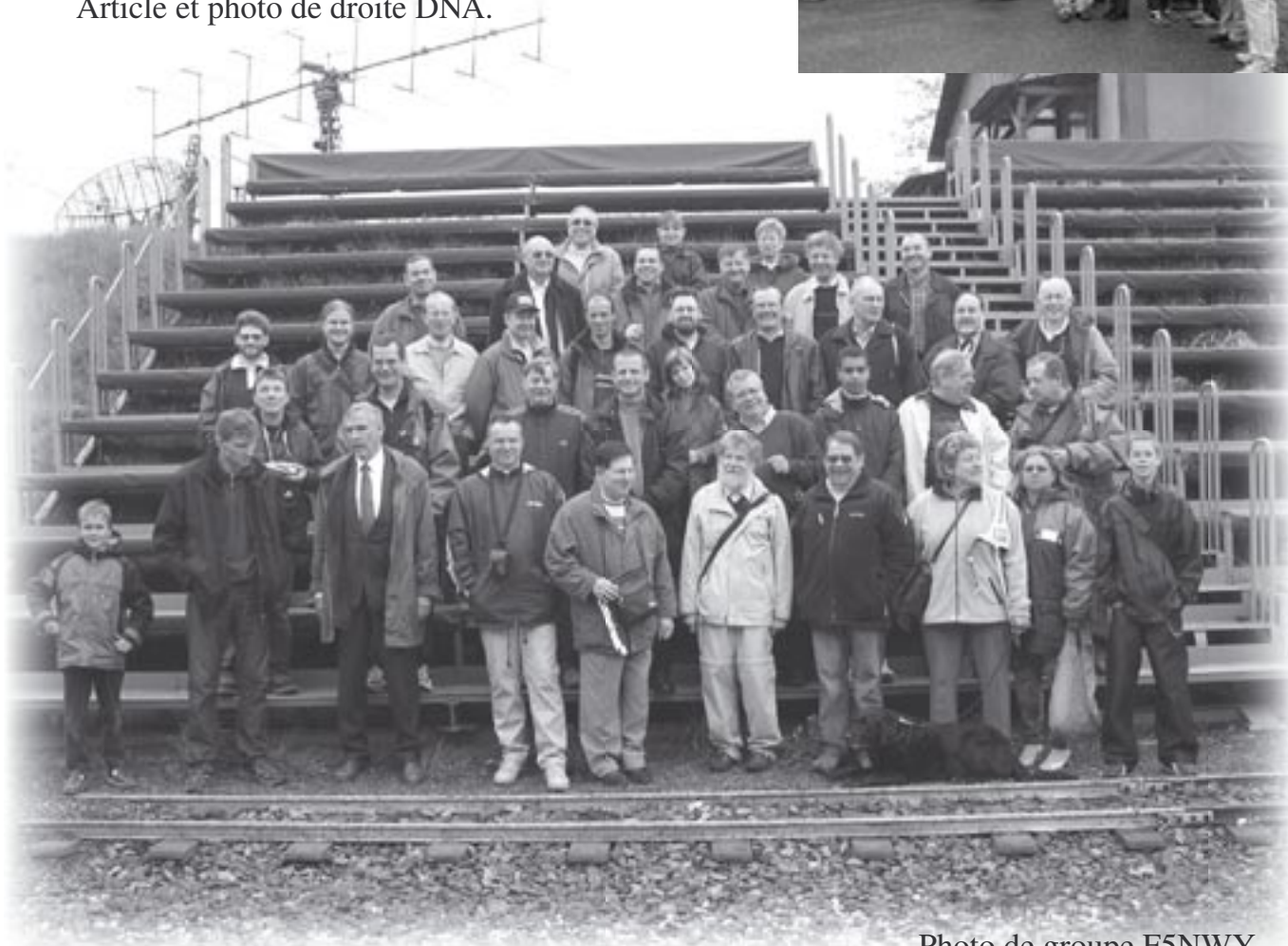
Photo de groupe F5NWX